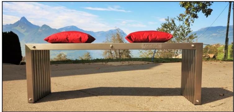
Sitzbank als Hochzeitsgeschenk aus Edelstahl

Bei der Reinigung und Pflege der Chromstahlteile möchten wir wie folgt unterscheiden: